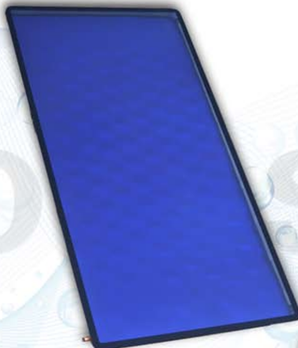
modelo NOVASOL VTTi